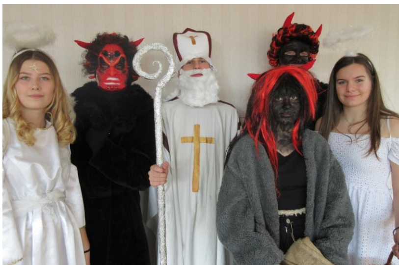
Obrázek 1. Žákyně a žáci 9. A