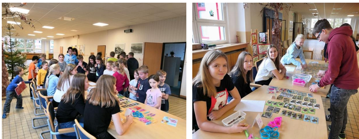
Obrázek 3. Foto z charitativní sbírky Srdíčkové dny