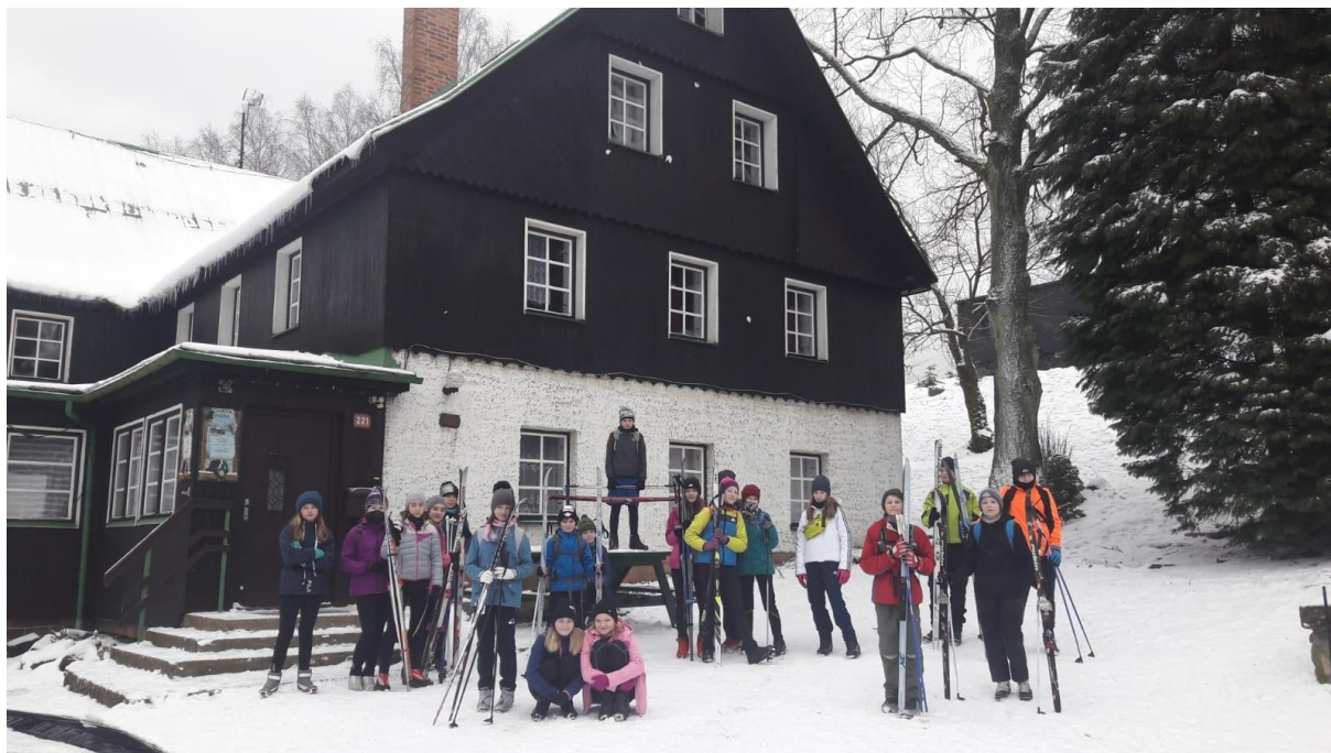
Obrázek 7. Lyžařský kurz 6. B, 7. A – „běžkování“