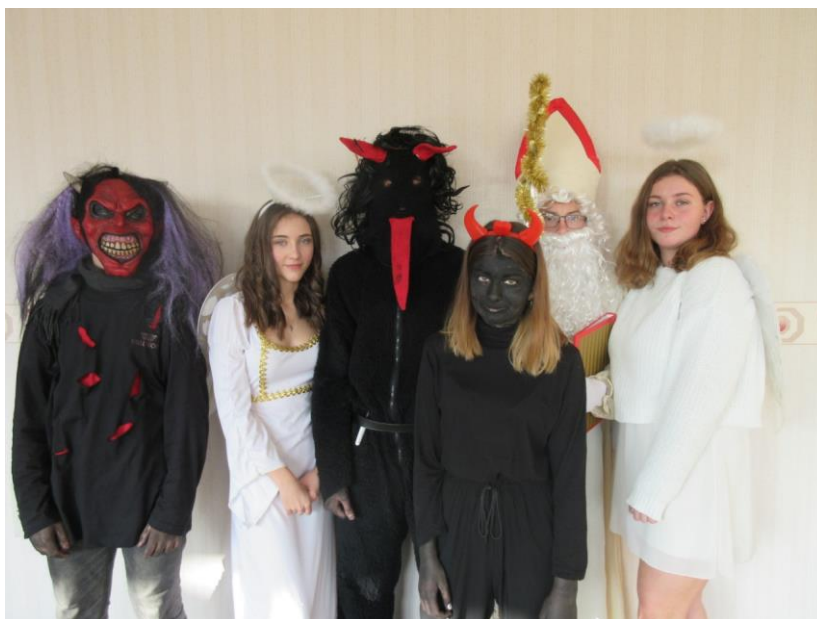
Obrázek 2. Žákyně a žáci 9. B