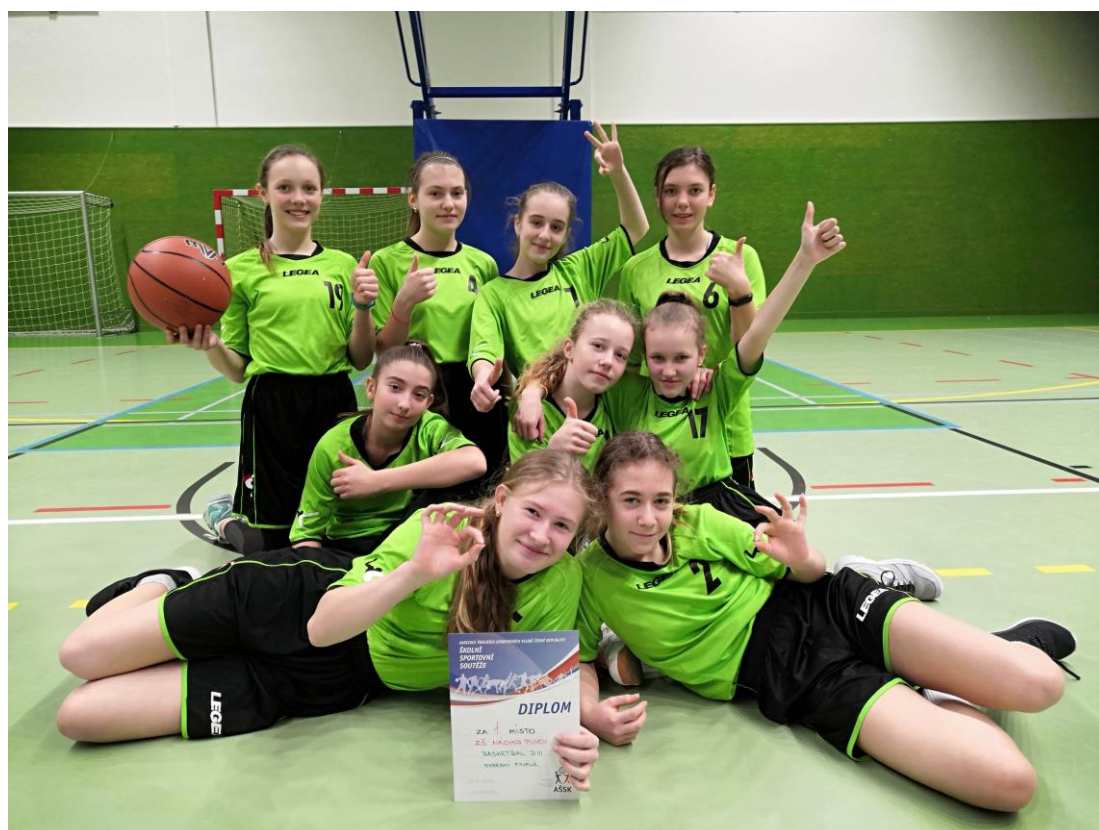
Obrázek 8. Dívky ze 6. B a 7. A na basketbalu v Jaroměři