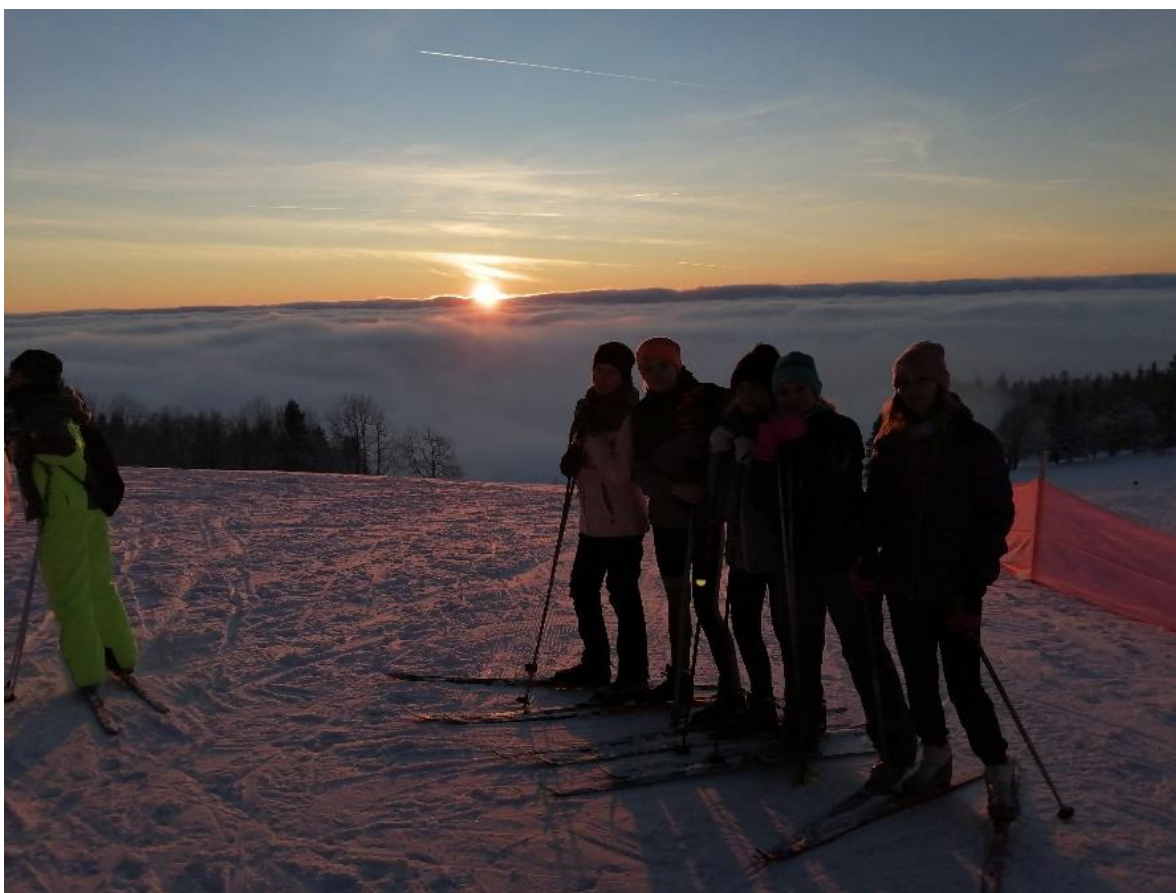
Obrázek 6. Západ slunce na lyžařském kurzu 8. C