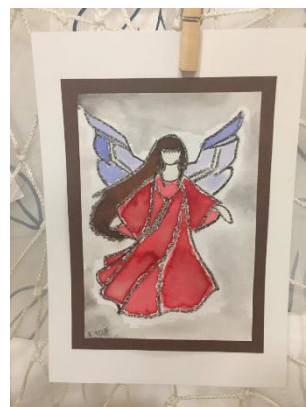
Obrázek 4. Vánoční výstava v prostorách školy